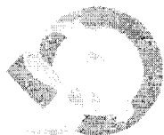
TABLA DE CONTENIDOS PAG.